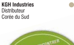
KGH Industries Distributeur Corée du Sud