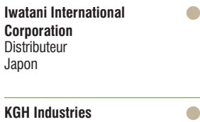
Iwatani International Corporation Distributeur Japon